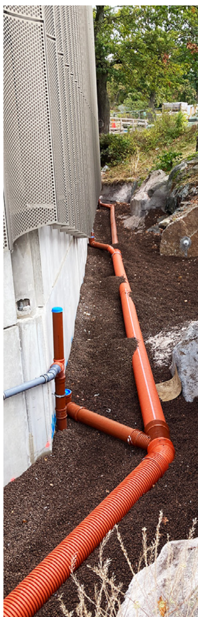
Leca® letklinker bruges som bagfyld til at stabilisere den porøse klippe ved siden af bygningen.

For at sikre stabilitet besluttede teamet at fylde rummet op igen for at understøtte den svækkede klippe. Leca® letklinker blev valgt til opgaven.