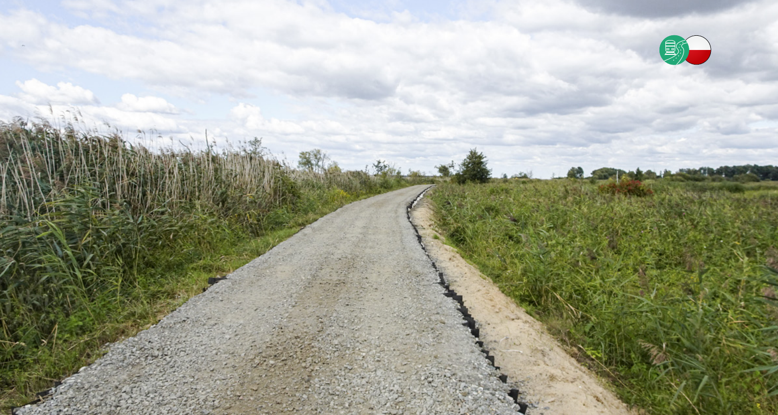
Leca LWA Geotechnical 8/10-20 RX er flere gange lettere end naturlige tilslag eller jord.