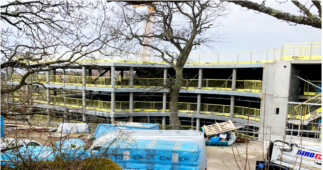
Parkeringsstrukturen blev tilpasset for at bevare egetræet og beskytte den lokale biodiversitet.