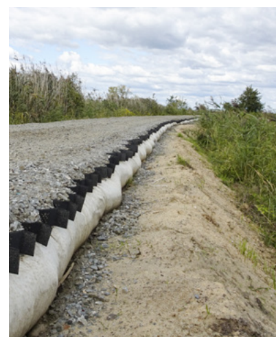
Dernæst blev et 20 cm tykt overfladelag lavet af 0-31,5 mm tilslag lagt i et geonet.