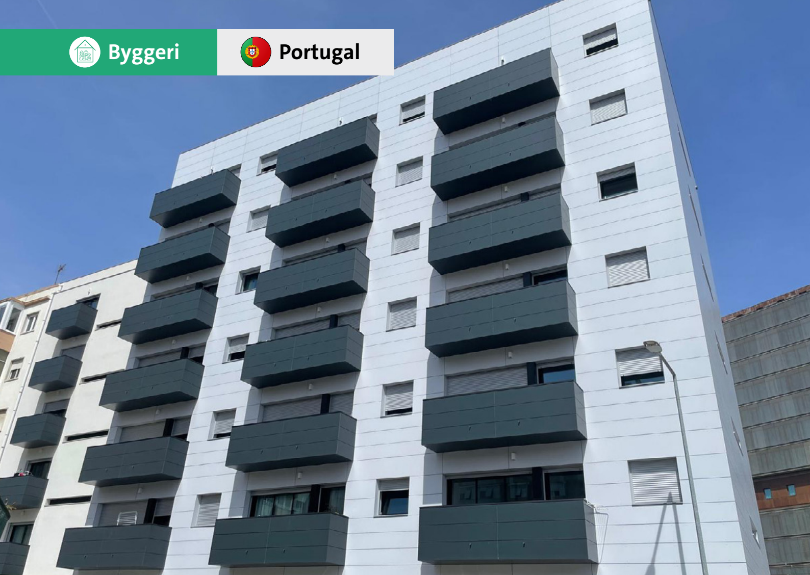
Leca® Uno bruges i et stort boligprojekt i Lissabon.