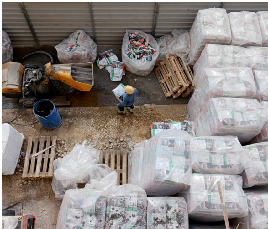
Leca® Uno blev leveret på paller, tilsæt vand og så er man i gang.

Brugen af Leca® Uno i dette projekt viser værdien af Leca renoveringsløsninger i forhold til at understøtte moderne, socialt ansvarligt byggeri. Ved at kombinere effektivitet, bæredygtighed og teknisk ydeevne spiller Leca® Uno en aktiv rolle i at levere boliger, der har en positiv social og miljømæssig indvirkning.