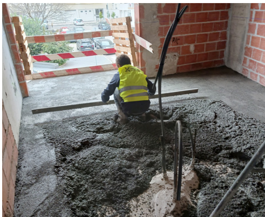
Leca® Uno er nemt at arbejde med.