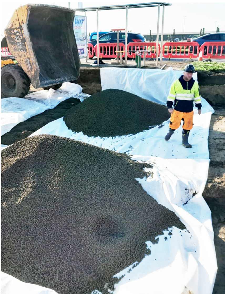
Leca letklinker blev valgt som et letvægtsfyldningsmateriale, hvilket reducerer sætninger forårsaget af lasten betydeligt.