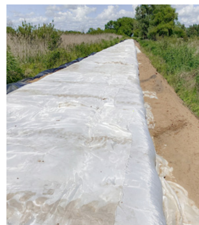
Strukturfyld i form af "madrasser" lavet af letvægts ekspanderet leraggregat indpakket i geosyntetisk stof

Konstruktionen blev designet og konstrueret ved hjælp af "madrasser" lavet af Leca® letklinker indpakket i geosyntetisk stof. Dæmningens skråning og underkonstruktionen af dæmningens krone blev bygget med 40 cm tykke madrasser. Oven på dette blev et 20 cm lag af 0-31,5 mm tilslag lagt i et geonet for at danne overfladen.