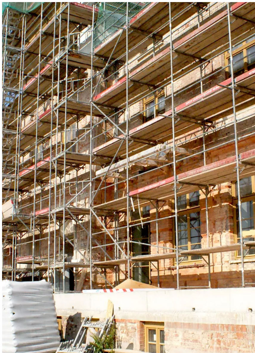
Renovation of bygning

Bygningen blev klassificeret som bygningsklasse fem i henhold til statens bygningsreglement, hvilket indebærer særligt høje krav til brandbeskyttelse. Lejlighederne skulle derfor tilpasses gældende brand- og lydisoleringsstandarder. Til dette formål blev de eksisterende træbjælkelofter statisk forstærket, og for at opnå bedre lydisolering blev der installeret i alt 250 m 3 bundet fyld i niveau med overfladen. Materialet blev transporteret med afretningspumpe op til 3. sal og vandret over afstande på op til 30 meter.