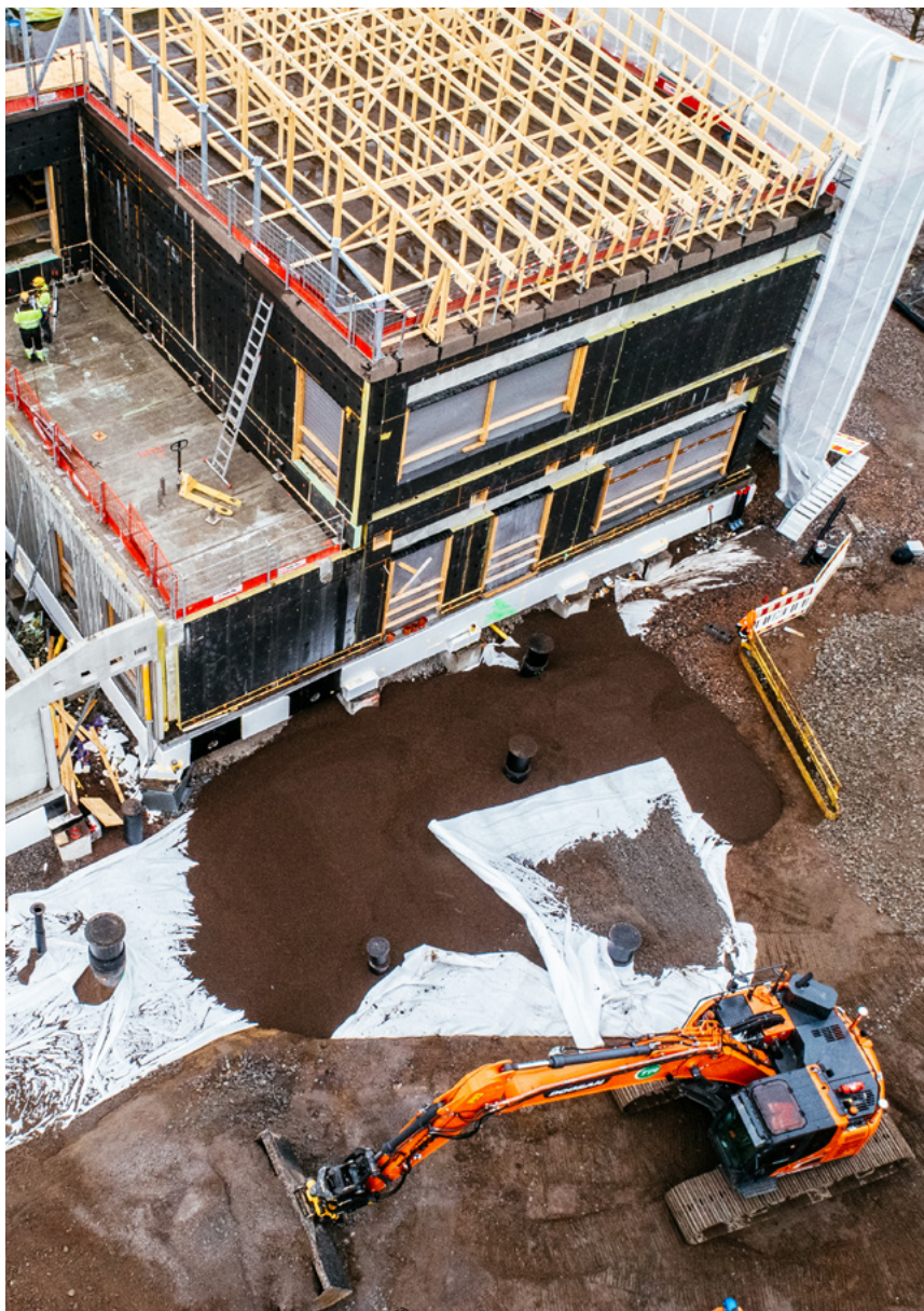
Over 2.000 m 3 Leca letklinker blev brugt til letfyldningerne på Puotila Skole.