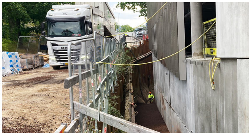
Leca® letklinker leveres ved blæsning for at nå svært tilgængelige render ved parkeringsstrukturen.