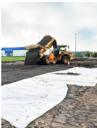
Tilstedeværelsen af blød jord gjorde konventionelle byggemetoder uegnede til projektet.