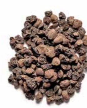
Ø 4-10 mm

Fine knækkede Leca® letklinker (< 5 mm) er optimalt for maksimal forsinkelse af vand. Materialet er specielt anbefalet til grønne tage og som underlag for permeabel belægningssten. Densiteten er typisk 400-500 kg/m 3 .