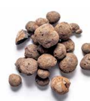
Ø 10-20 mm

Grove knækkede Leca® letklinker (4-10 mm) har mindre finstof og højere hydraulisk permeabilitet. Dette er en fordel når man vil undgå store variationer i vægten på grund af vandabsorption. Grove knækkede Leca® letklinker er lettere med en densitet på 250-300 kg/m 3 .